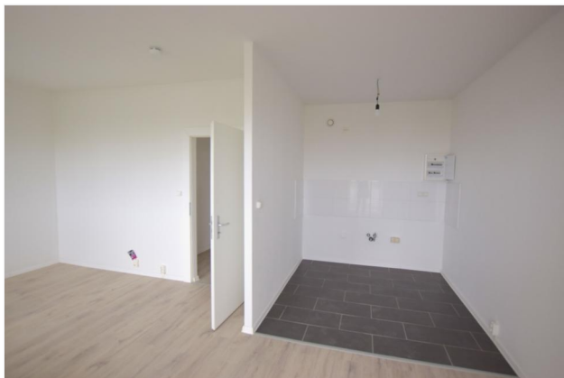
Wohnzimmer - Küche