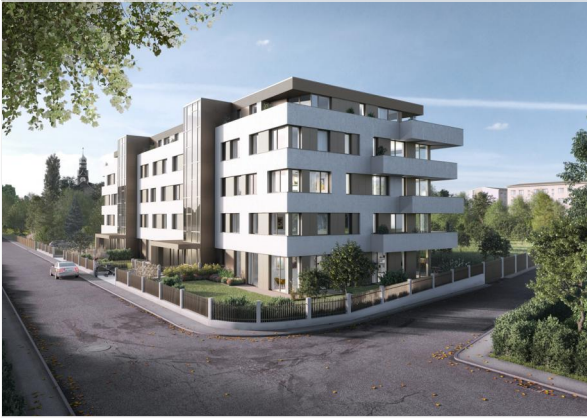
Ansicht - Visualisierung